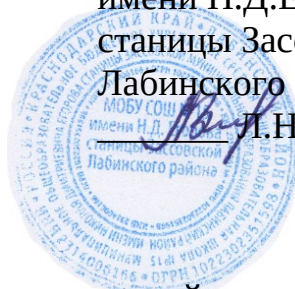
График питания учащихся в школьной столовой МОБУ СОШ № 15 имени Н.Д.Егорова станции Зассовской Лабинского района на 2023-2024 учебный год